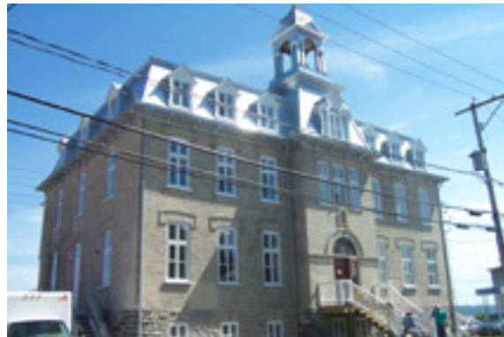
cédérom no : 3 Photo no 2 : dcp_1891