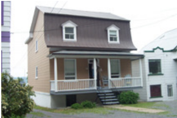
cédérom no : 3 Photo no 1 : dcp_1987

TYPE D'ENSEIGNE NOMBRE DISPOSITION aucun TYPE de COMMERCE: