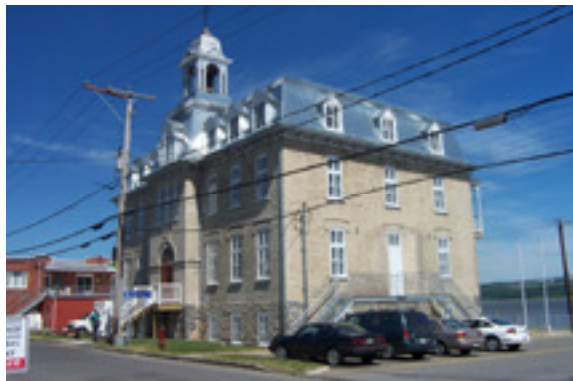
cédérom no : 3 Photo no 1 : dcp_1890