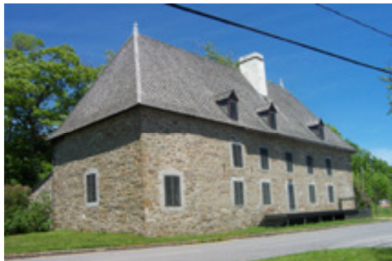
cédérom no : 3 Photo no 1 : DCP_1686