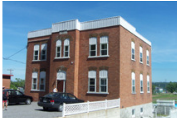
Photo no 6 :