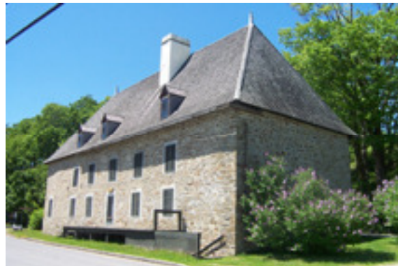
cédérom no : 3 Photo no 2 : DCP_1687