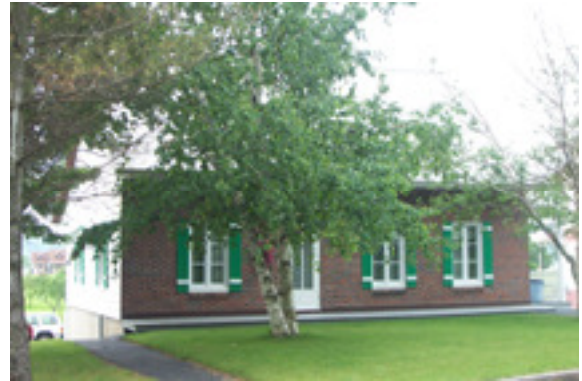
Photo no 6 :