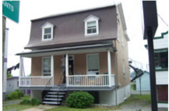
cédérom no : 3 Photo no 2 : dcp_1988